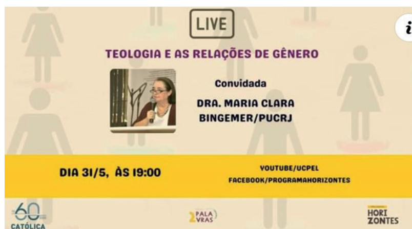
Figura 1: Card Teologia e as relações de gênero

Desse modo, as atividades do ano de 2021, visaram cumprir a amplitude do saber teológico em sua dimensão interdisciplinar, mas levando com conta, a reflexão sobre a fé.